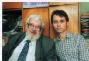
Беседу вел Евгений ВЛАСОВ

В жизни я занимался самой главной и благородной профессией. И очень рад этому. Молодым людям могу пожелать: если хотите быть счастливыми, будьте ими! Это самая простая формула счастья. Больше вам ничего не надо.