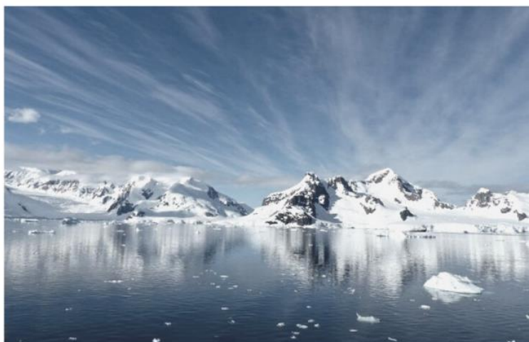
Международный экспертный совет по сотрудничеству в Арктике, 2020