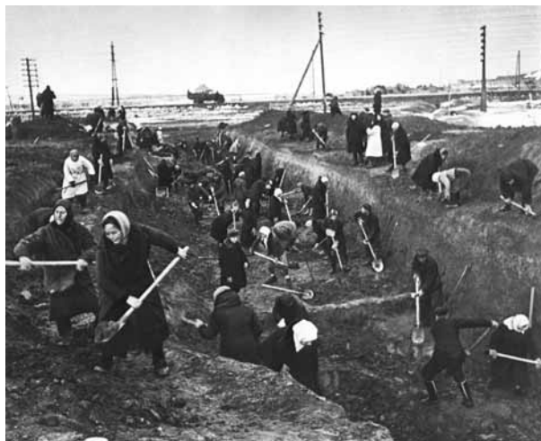
Студенты на рытье окопов и противотанковых рвов. Август-сентябрь 1941 года

«Институт нас встретил очень просто – расписанием и учебой в соответствии с учебным планом, без особой лирики. Да для лирики и оснований не было: страна воевала, а нам было приказано учиться, пока мы не понадобится в других местах.