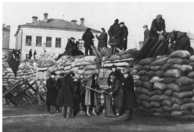
Баррикады на улице Москвы. Октябрь 1941 года