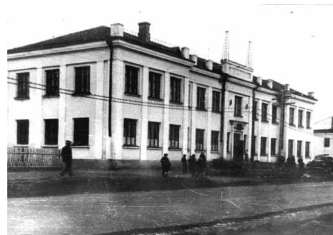
Административный корпус МНИ им. И. М. Губкина в эвакуации. Соцгород. Фотография 1947 года