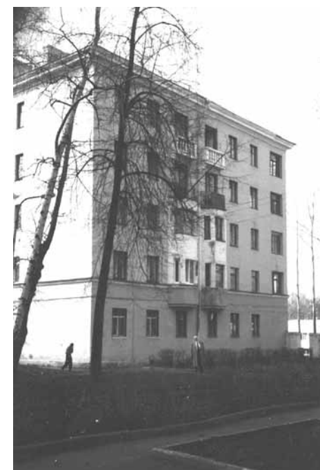
Соцгород. Корпус А-3, где на 3 этаже под балконом находилась институтская комната