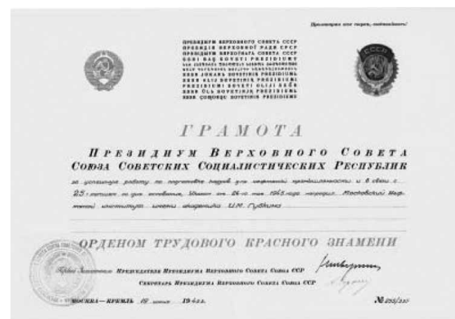
Грамота о награждении Московского нефтяного института Орденом Трудового Красного Знамени

Если же, однако, будет признано более целесообразным оставить в Уфе все курсы МНИ, то, наряду с немедленным укреплением руководства института местными работниками, необходимо, не медля ни единого дня (чтобы не поставить учебный процесс на старших курсах перед полным провалом и катастрофой), вызвать для ведения занятий на старших