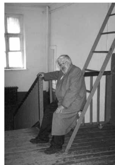
Рядом фотография с того же балкона через полвека и П. В. Флоренский на пожарной лестнице в холле этого дома. Фото 2005 года

но здесь все подкупают карточки на базаре 7 . Иждивен<ческая карточка> на крупу и мясо (здесь иждивен<енцам> дают 200 гр жиров и 300 гр мяса) стоит на базаре 30 р8. Все ходят и продают свои карточки совершенно открыто. На базаре здесь цены значительно ниже загорских. Со вчерашнего дня картошка подешевела до 8-9 р., но молоко дороже, чем в Загорске и за хлеб дают очень мало, за кило 1 литр. Бывает гороховая мука 1 кг 50 р. Мука хлебная такая же, как в Загорске – очень дорогая и достать