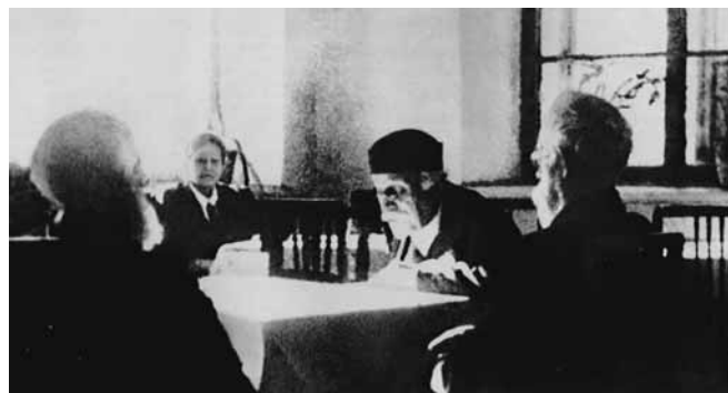
Академики в Боровом за вечерним чтением. Читает Н. Зелинский, справа В. И. Вернадский, слева - ??, в глубине - ...