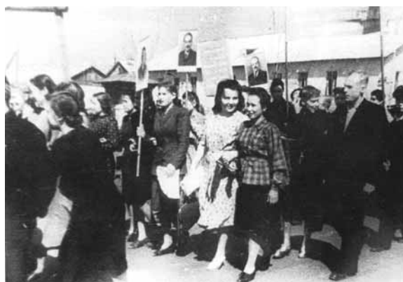
Коллектив МНИ на Первомайской демонстрации. Соцгород. 1943