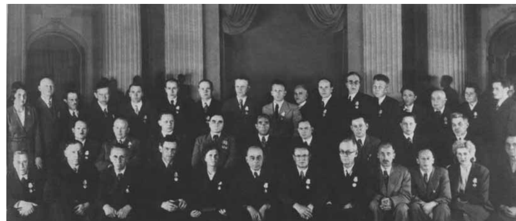
Сотрудники института, награжденные орденами и медалями в честь 25-летия МНИ. Москва, Кремль. 1945.